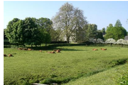
zicht op kasteel

Vorig jaar zijn koolmezen gevangen op de Veluwe en een nabij gelegen stad. Dit jaar willen ze in Maastricht en in het Froweinbos vangen.