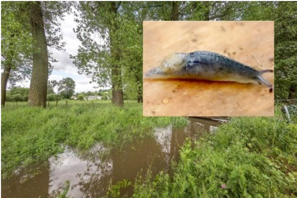
De twee slakkensoorten zijn gevonden in de buurt van de Eyserbeek.

Natuuronderzoekers hebben bij Eys ook een tweede voor Nederland unieke slakkensoort ontdekt. Net als de eerste heeft ook de tweede een klein huis op de rug waar het weekdier niet in past.