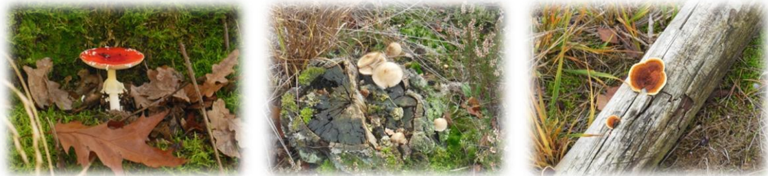
“herfst op de Brunsummerheide – november 2020”