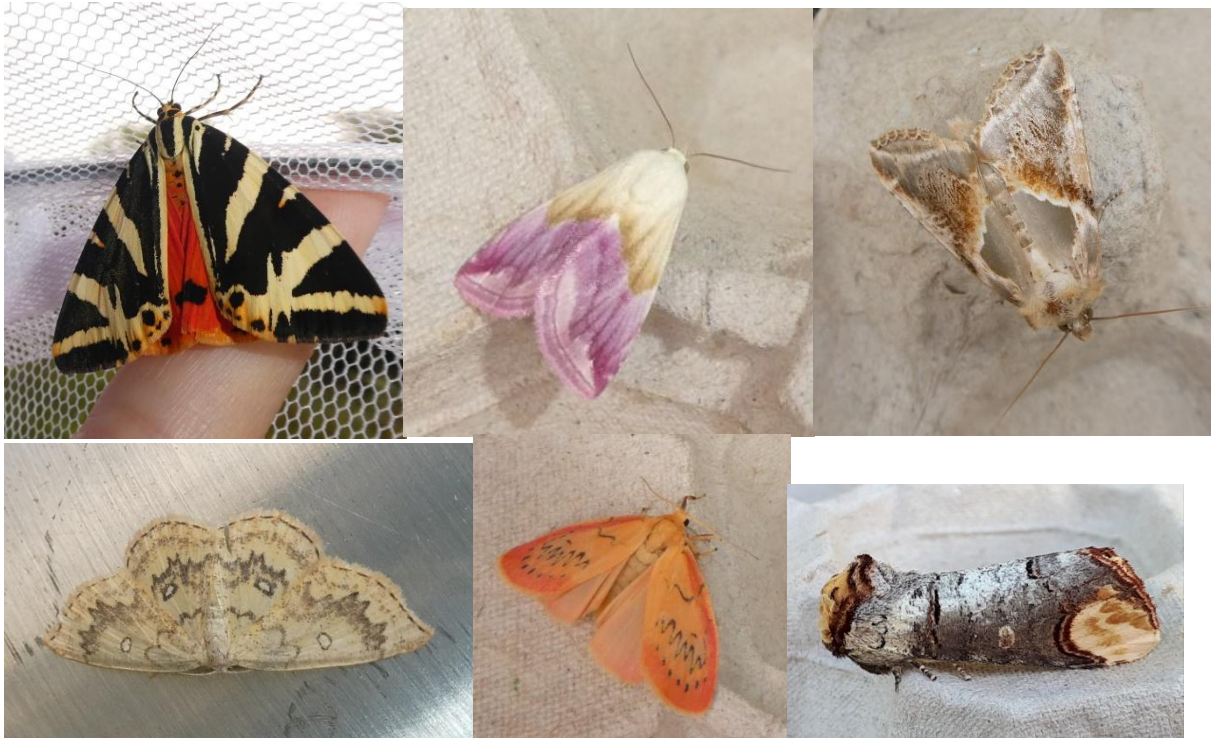
Nekspindertje (zeer zeldzaam)