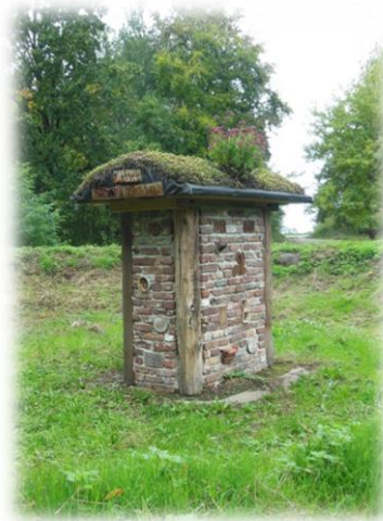
“ impressies uit het Wormdal – oktober 2020 ”