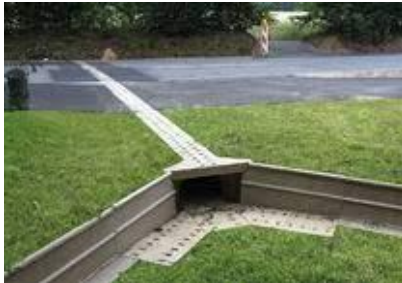
Aco Pro Faunatunnel

Bij de landbouwingangen worden dassenroosters geplaatst die ervoor zorgen dat er geen dieren op de weg terecht komen.