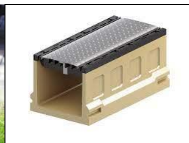
Opvangelement met afdekplaat