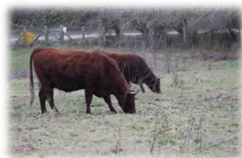
“ Nieuwjaarswandeling 12-01-2020 “