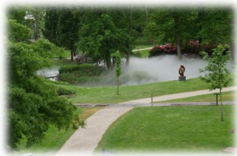
Impressies uit de Kasteeltuinen Arcen