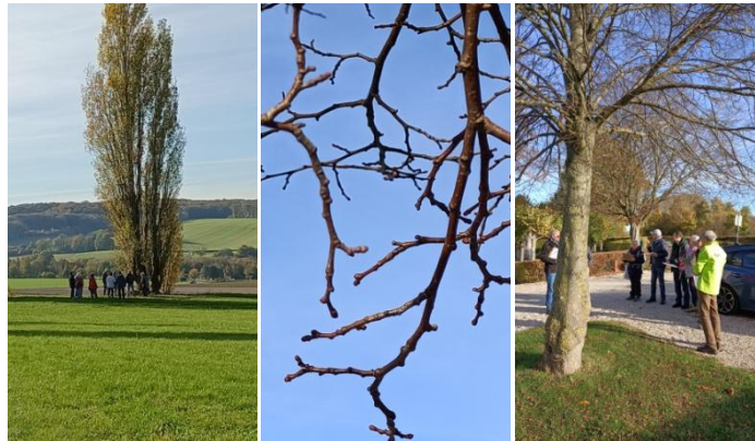
“12-11-2022: impressies van de bomencursus.”

De volgende lessen zijn inmiddels gepland, in ieder seizoen een binnen- en een buitenles.