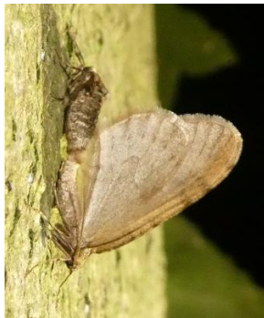
parende Kleine wintervlinders

En er is nog iets vreemds aan de hand. Van sommige soorten herfst- en winternachtvlinders kunnen de vrouwtjes namelijk niet vliegen. De vleugels zijn gereduceerd tot korte stompje. Ze zien er niet eens uit als een nachtvlinder. Nadat de vrouwtjes in de grond verpopt zijn, kruipen ze uit hun cocon en dan langs de stam van de waardboom of -struik omhoog en wachten daar op de mannetjes. Na de bevruchting zijn de vrouwtjes meteen bij de goede boom om hun eitjes af te zetten.