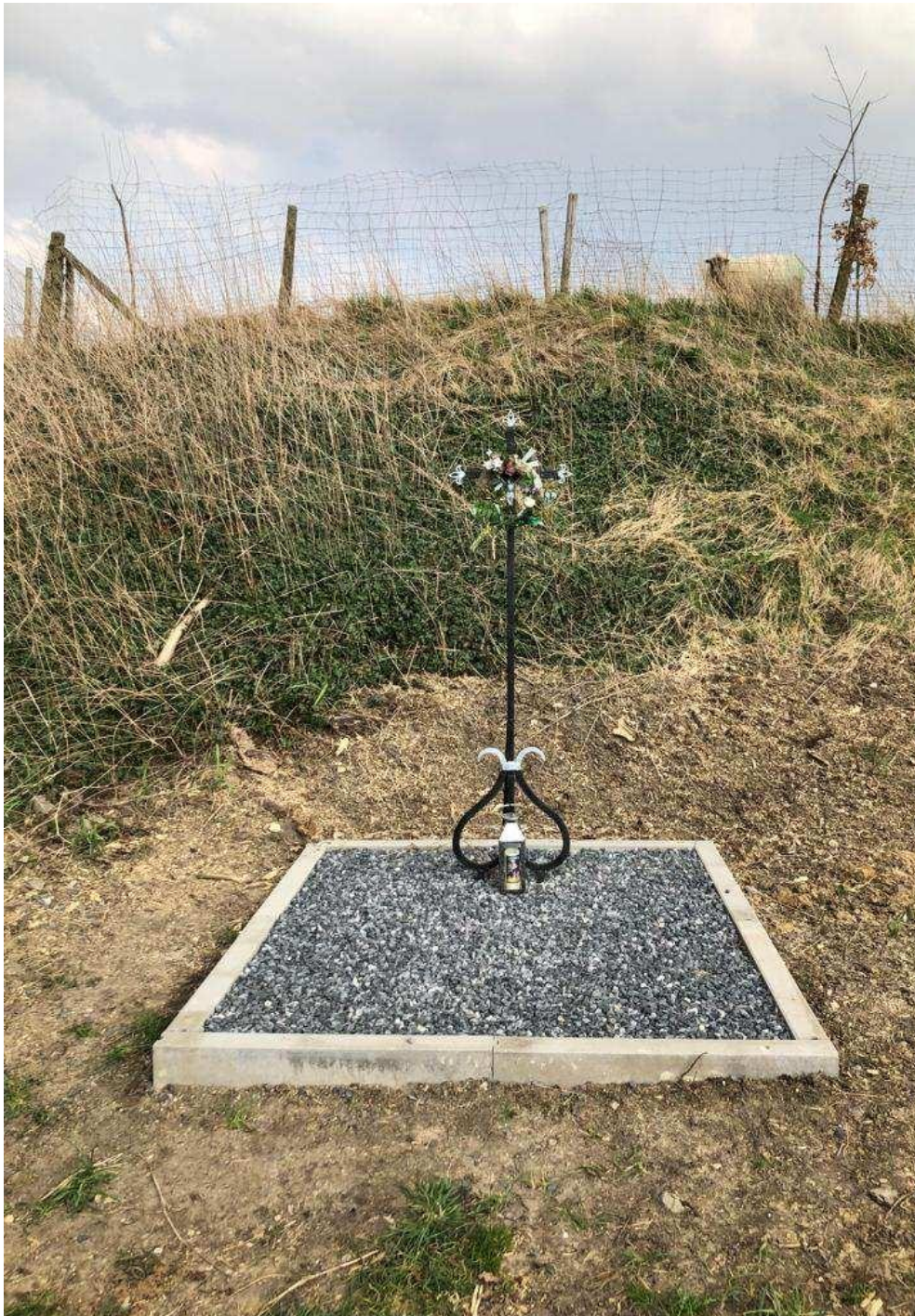
“huidige, vernieuwde aanzicht wegkruis Nijswillerpad – Op de Kamp”